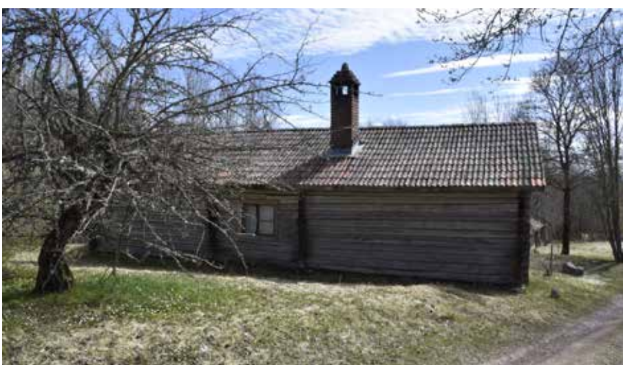
En skarv mitt på baksidan på Kajgårdens parstuga vittnar om att byggnaden sannolikt hopförts av två enkelstugor. Fönstret i mitten leder in till byggnadens kammare. Mot de väggar som saknar fönster finns sannolikt väggfasta tarr- eller förlåtsängar på insidan. Västberg 9:9.