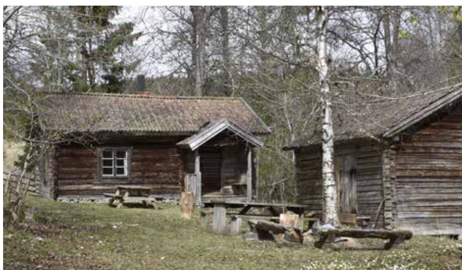
Enkelstuga om en våning som blivit raststuga. Byggnaden har en ålderdomlig farstukvist. Noret 2:27.