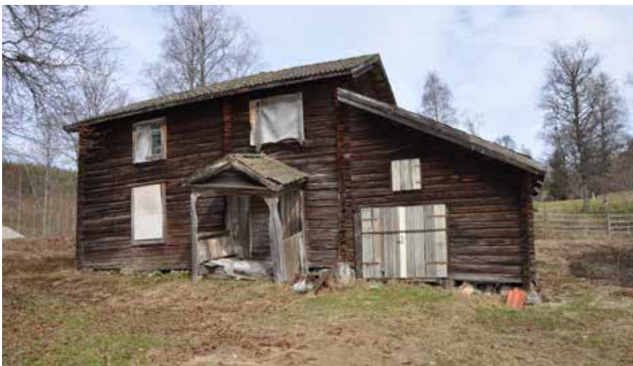
Ålderdomlig enkelstuga med många vackra gamla detaljer. Farstukvisten är typisk för Leksandsbygden. Fönstren på övervåningen med blyspröjs är synnerligen ålderdomliga. Böle 1:5.