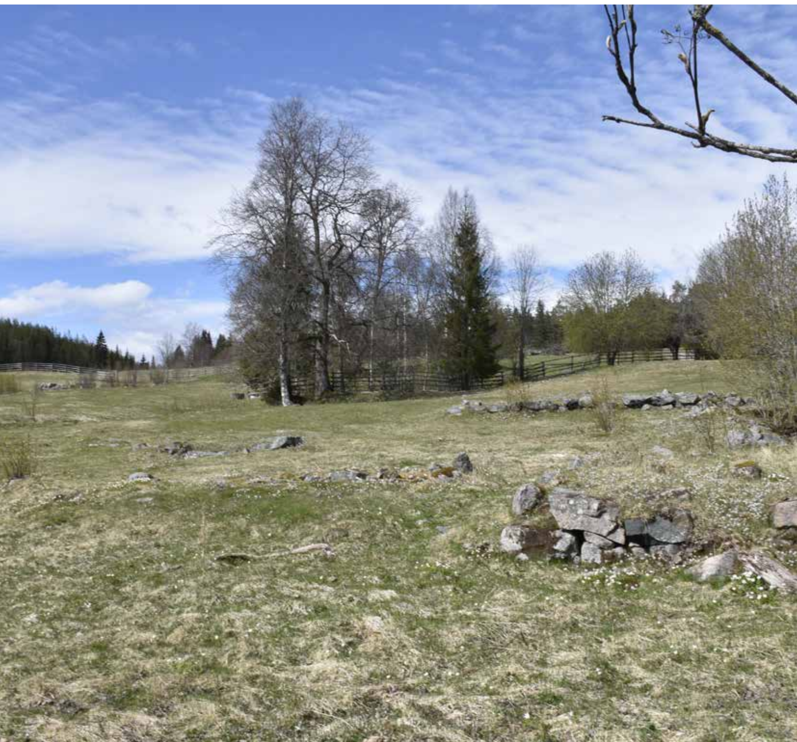
Lämningar efter fyrkantsbyggd gård som finns utmarkerad på storskifteskartan. Husgrunden vittnar fortfarande om byns utbredning i äldre tider.