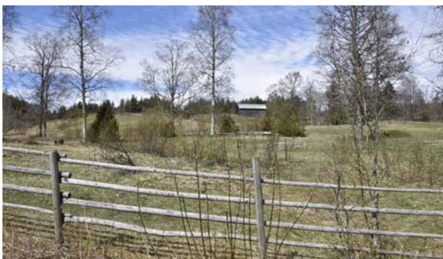
Beteslandskapet avskiljs med hjälp av enkla gärdesgårdar.