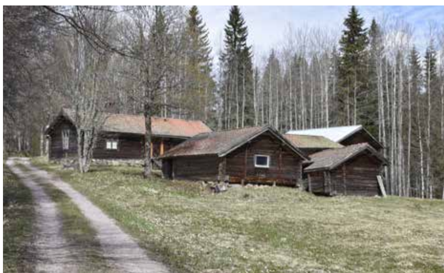
Kajgården har en delvis sluten karaktär och utbildar ett eget gytter av hus. Västberg 9:9.