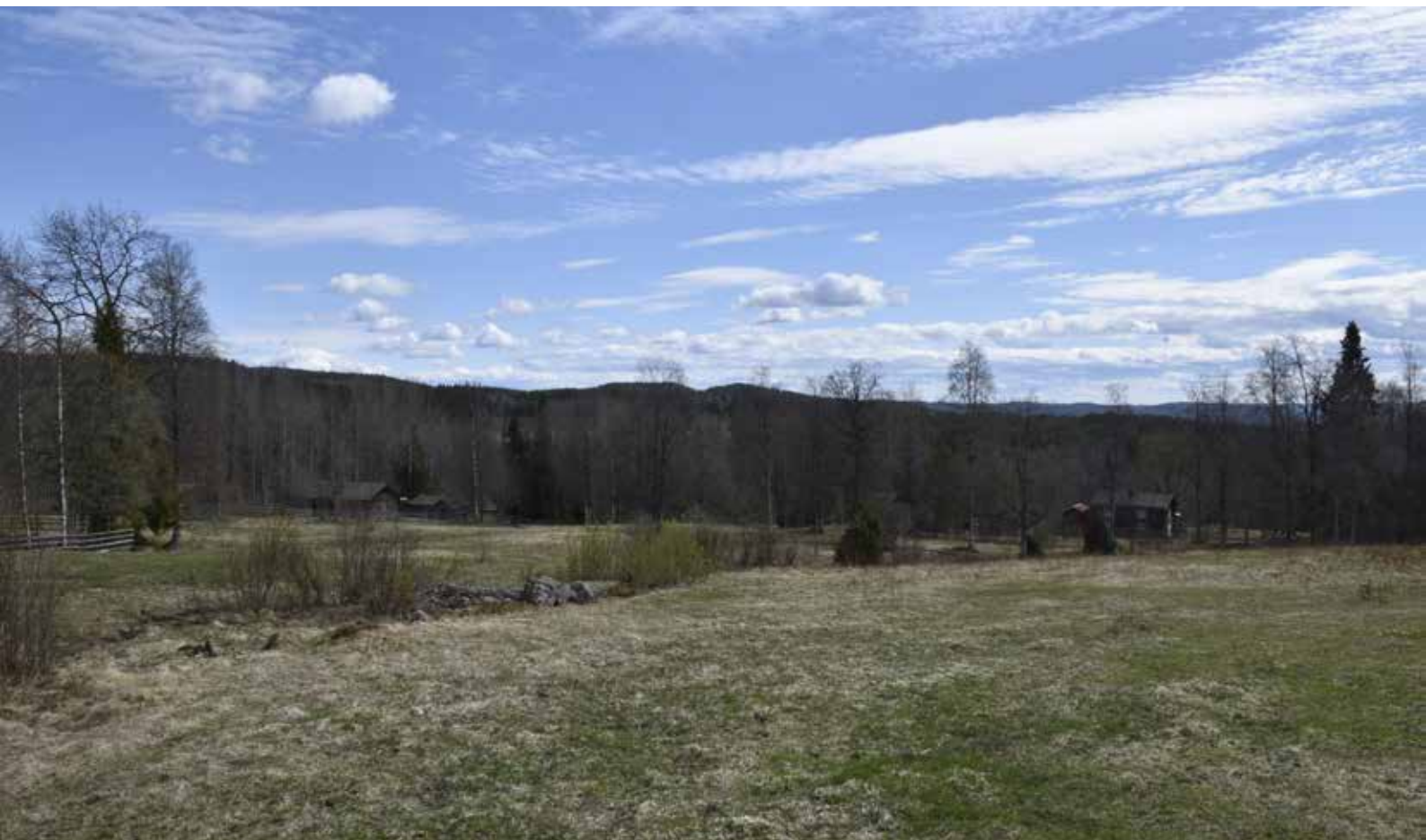
Utsikt från det öppna beteslandskapet i norr.

Om fruktträd vårdas på rätt sätt kan de bli gamla och de kan vara värdefulla karaktärsskapare på gårdarna. Alléer, som kan vara enkelradiga eller dubbelradiga, förknippas ofta med högreståndsmiljöer, vilket det är knappt med i Leksands bymiljöer, men de kan även ha planterats längs vägarna för att ge vindskydd och skugga. De kan också ha använts för lövtäkt.