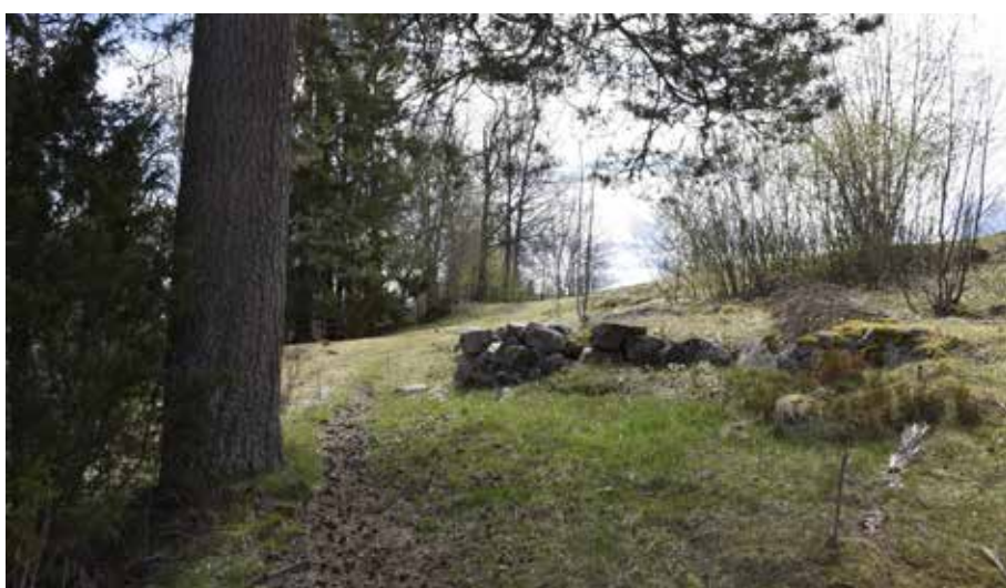
Överallt i landskapet finns lämningar av odling och historisk djurhållning.