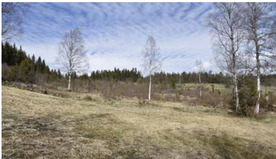
Norr om byn utbreder sig ett storslaget öppet och hävdad beteslandskap.