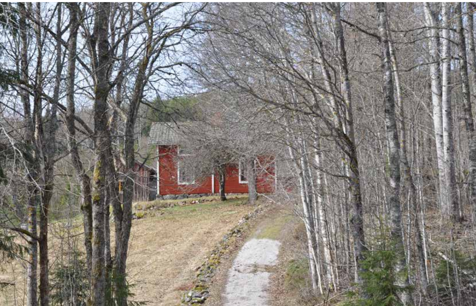
Kringbyggd gård med enkelstuga och ålderdomliga timmerbyggnader i den södra delen av byn. Gården är belägen på samma plats som vid storskiftet år 1826 och delar av byggnadsbeståndet är sannolikt detsamma som vid storskiftet. Böle 3:4.